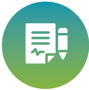
Le contrôle environnemental

C'est pourquoi la permanence a travaillé avec les membres de l'association pour bonifier la structure de concertation. En avril 2024, nous avons annoncé la création de quatre nouveaux chantiers pour mieux traiter les enjeux transversaux, soit :