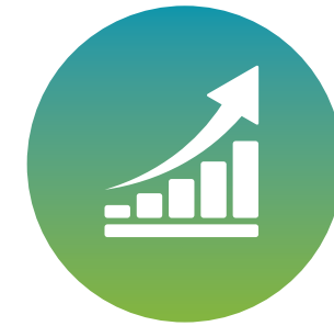
Le développement économique

Ces enjeux touchent plusieurs secteurs et requièrent une position cohérente pour atteindre des résultats concrets. Ces chantiers seront déployés au cours de l'année et leur coordination sera assurée par la permanence.