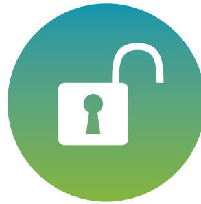
Les autorisations environnementales